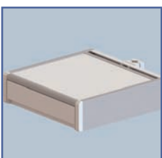
EGF 7500108 Tiroir fixation Murale