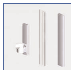
EGF 91142 Rail passage de câbles mural 120 cm