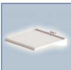
EGF 7500204 Plateau de travail fixation Murale