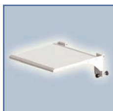
EGF 7500202 Plateau de travail fixation sur Din Rail