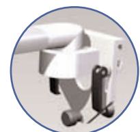
Fixation din rail